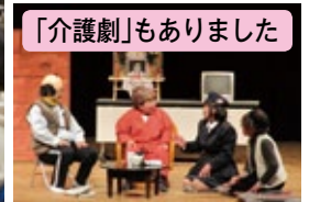
「介護劇」もありました