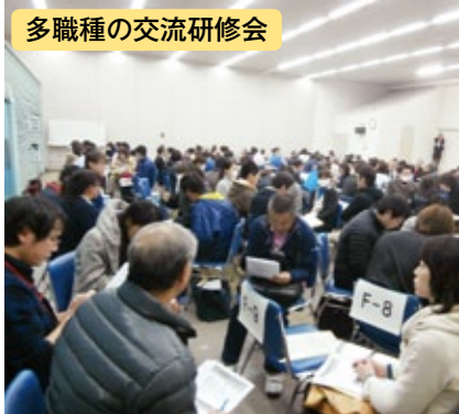
多職種の交流研修会

平成27年度は、住民向け研修会を出水市（9/14地域医療を考える会）、阿久根市（11/14在宅医療講演会）、長島町（12/6長島フェスタ）で開催し、在宅医療についての普及啓発を行いました。今後も在宅医療に関する研修会を行っていききたいと思います。