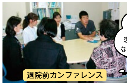
退院前カンファレンス