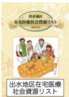
出水地区在宅医療社会資源リスト