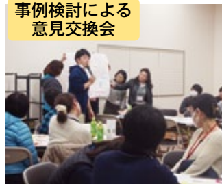
事例検討による意見交換会